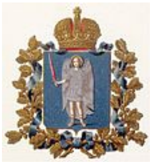
Официальный герб губернии (изд. МВД , 1880 )