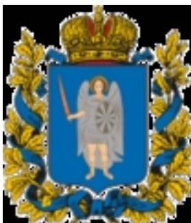
Современный рисунок герба губернии ( 2000-е годы )