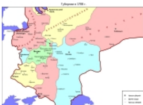
Карта российских губерний в 1708 году