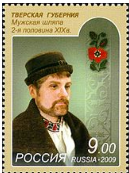
Почтовая марка России , 2009 год