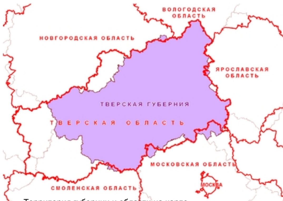
Территория губернии и области на карте