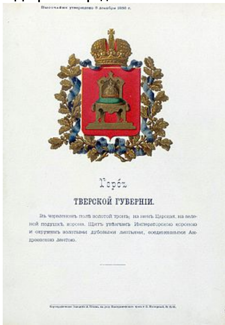
Герб губернии с оф.описанием, утверждѣнный Александром II ( 1856 )

Воробьёвы , Жолобовы , Завалишины , Зыковы , Игнатъевы , Извековы , Изединовы , Казариновы