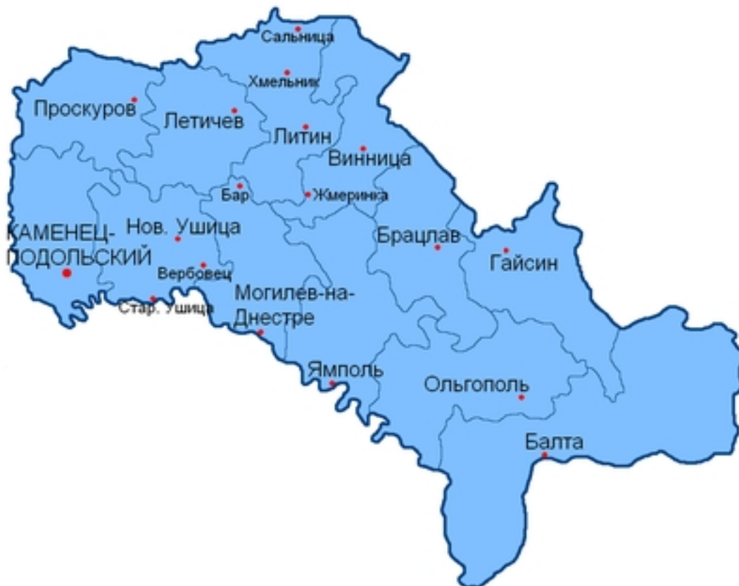
Карта административного деления Подольской губернии

В конце XIX века в состав губернии входило 12 уездов :