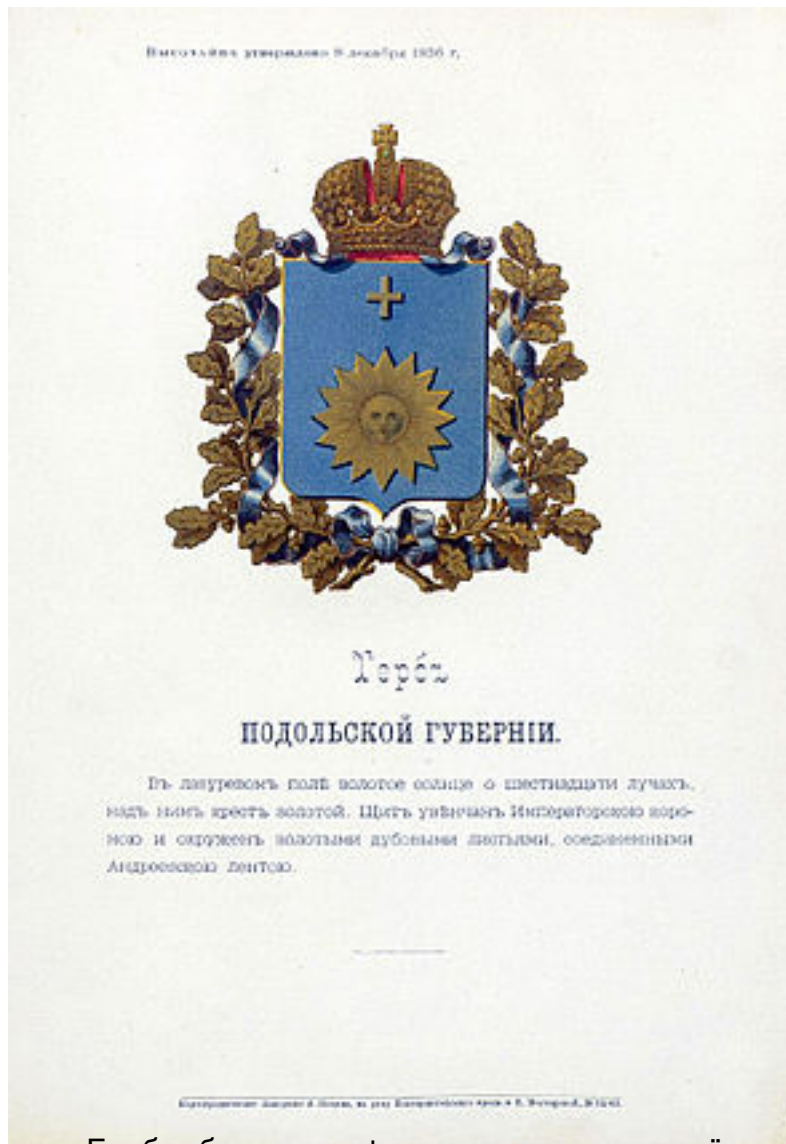
Герб губернии с оф.описанием, утверждённй Александром II ( 1856 )