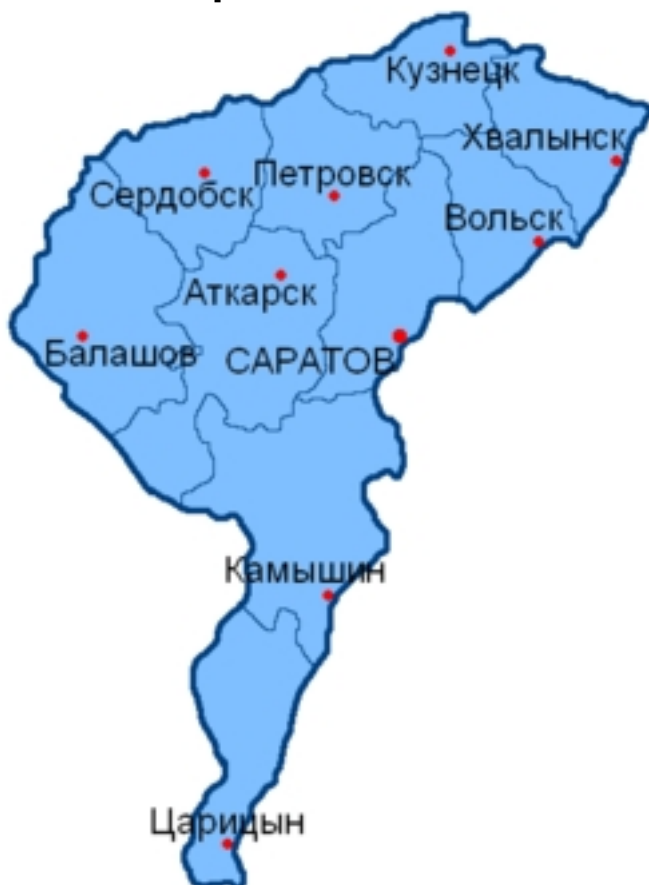
Карта административного деления Саратовской губернии

С 1851 по октябрь 1918 года в состав губернии входило 10 уездов :