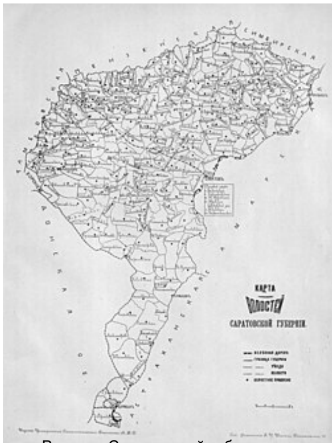
Волости Саратовской губернии