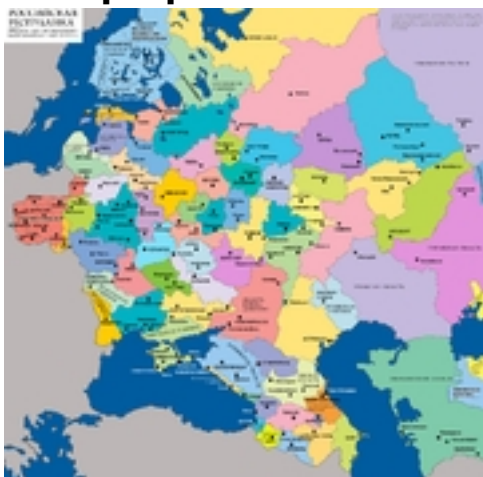
Административное деление России (западная часть) в 1917 году

К началу XX века Симбирская губерния занимала 49,5 тыс. км 2 (43 491 вёрст 2 ). Она граничила на севере с Казанской губернией , на востоке с Волгой , отделяющей её от Самарской губернии