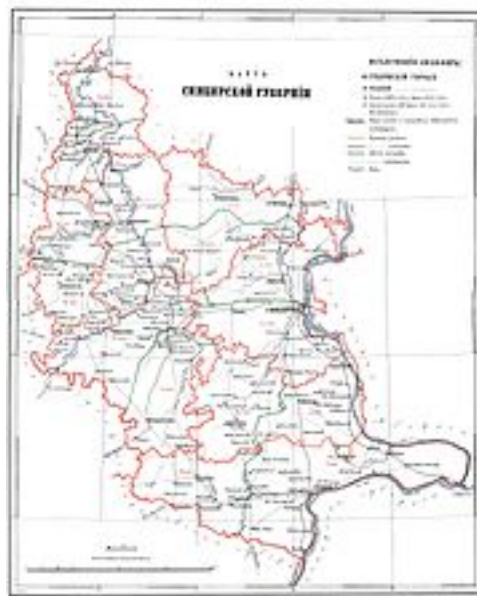
Карта Симбирской губернии 1859 года

Основная статья: История Ульяновской области