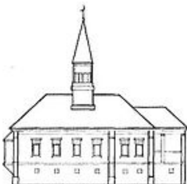
Соборная мечеть в Буинском уезде (1876) [14]

В 1898 году православных было 1 407 317 человек, мусульман — 144 440, раскольников и сектантов — 31 384, крещёных татар, отпавших от православия, — 4031, римско-католиков — 1831, протестантов — 1283, евреев — 472, язычников — 441, армяно-григориан — 4. Более всего раскольников было в уездах Сызранском (12 тыс.) и Алатырском (9 тыс.). В уездах Карсунском, Симбирском и Сенгилеевском число раскольников было от 3 до 4 тыс. в каждом.