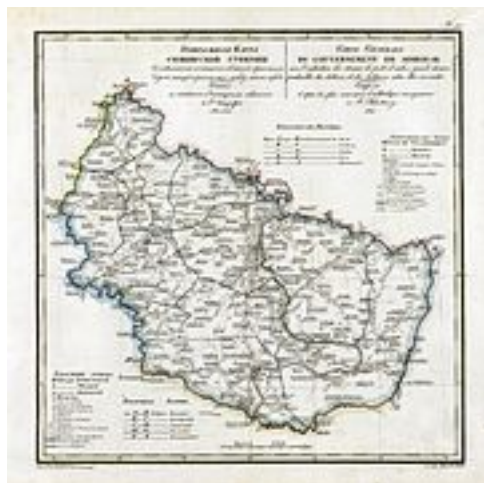
Карта губернии 1822 года

Климат Симбирской губернии был сходен с климатом соседних губерний. По незначительному пространству её климатические условия на севере и юге мало отличались друг от друга. Всего важнее были различия, происходившие от высоты над уровнем моря, большей или меньшей защитности положения и растительного покрова.