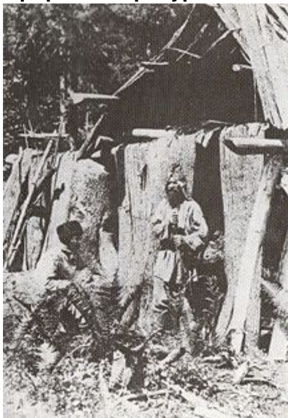
Симбирские крестьяне в лесу (1878)

В лесах Симбирской губернии из хвойных деревьев ель встречалась только в Алатырском и Курмышском уездах по Суре и её притокам,