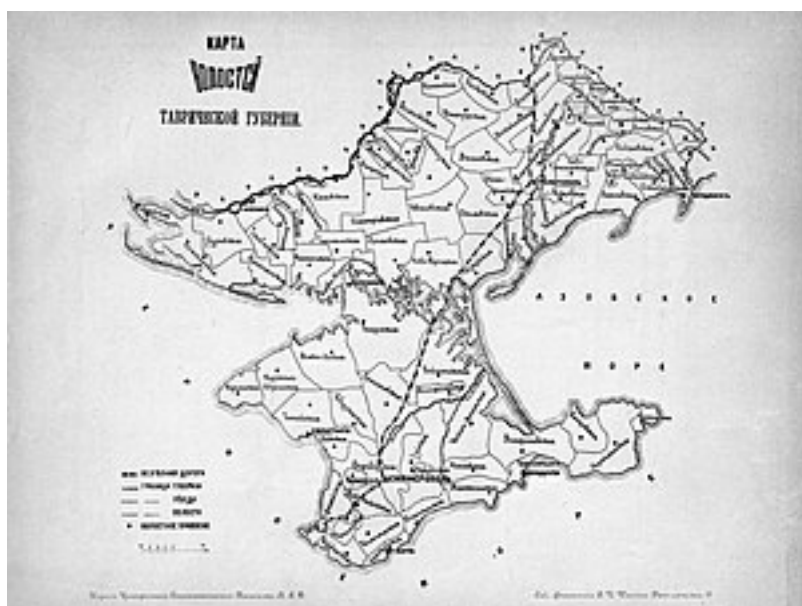
Волости Таврической губернии

В 1838 образован Ялтинский уезд, а в 1843 — Бердянский.