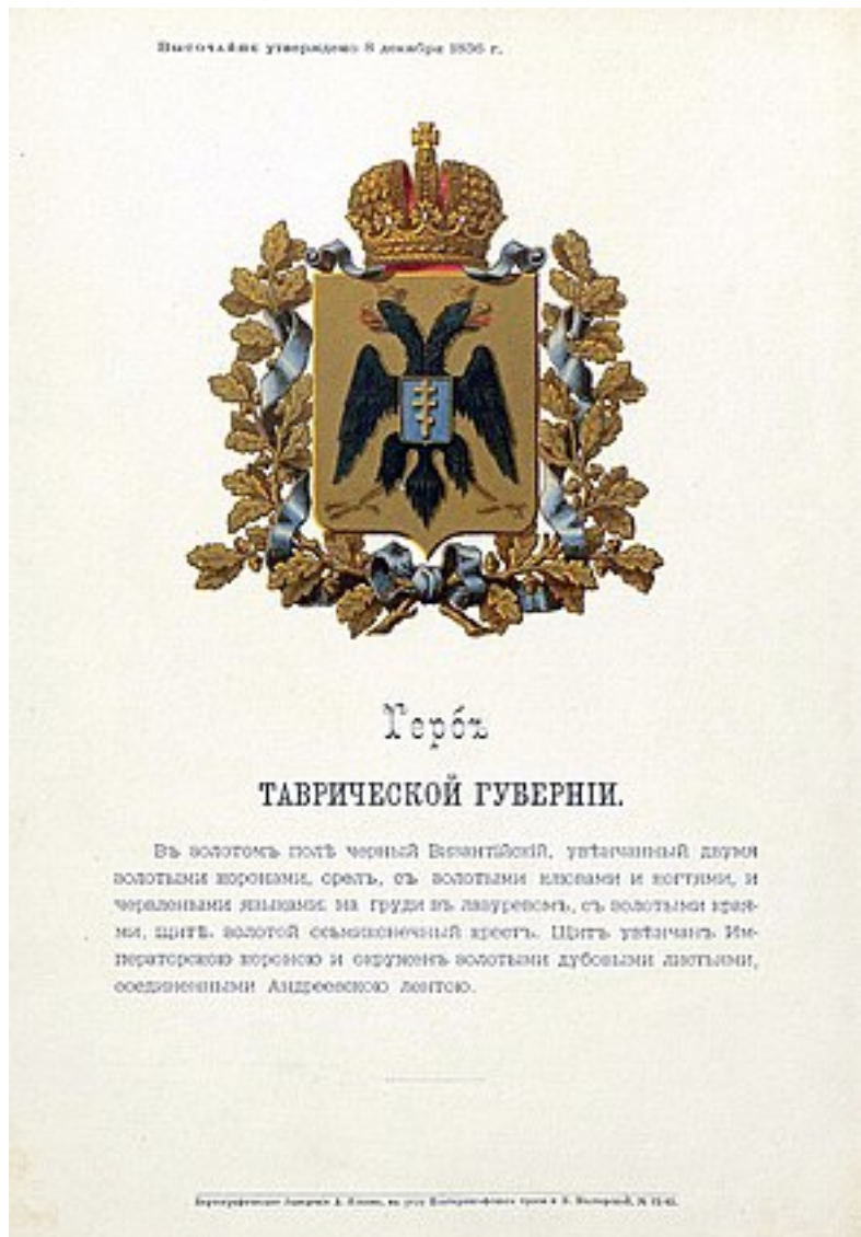
Герб губернии с оф.описанием, утверждѣнный Александром II (1856)