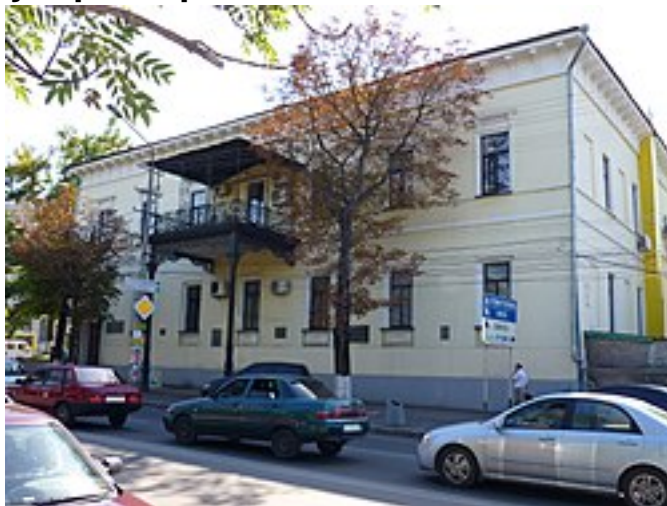
Дом губернатора Таврической губернии в Симферополе