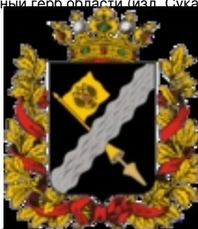
Современный рисунок Герба области ( 2000-е годы )