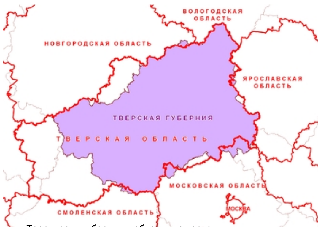
Территория губернии и области на карте