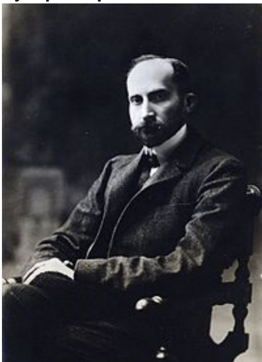
Н. Н. Львов , председатель Саратовской губернской земской управы