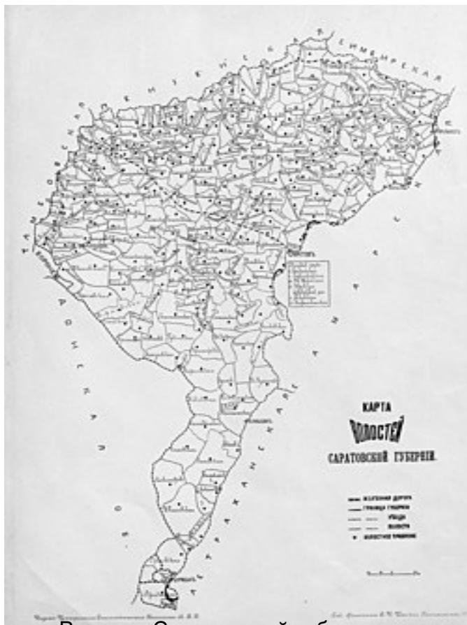
Волости Саратовской губернии