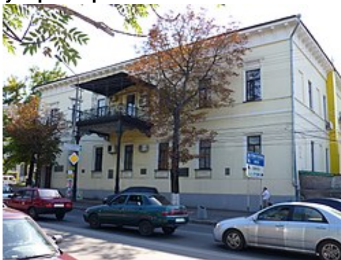
Дом губернатора Таврической губернии в Симферополе