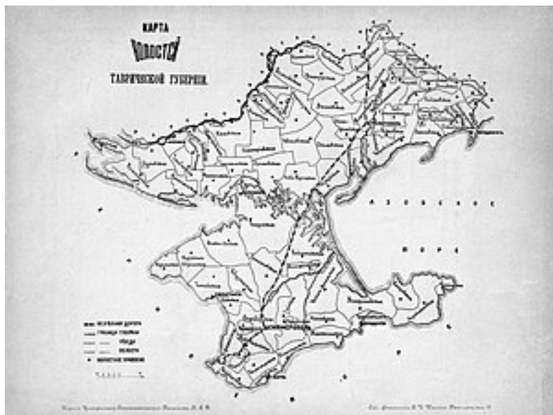
Волости Таврической губернии

В 1838 образован Ялтинский уезд, а в 1843 — Бердянский.