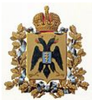
Официальный герб губернии (изд. МВД, 1880)