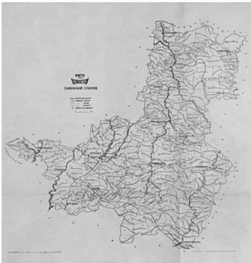
Волости Тамбовской области

В начале XX века губерния разделялась на 12 уездов :