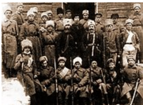
Объединенная партизанская армия Тамбовской губернии

Во время Гражданской войны из-за чрезмерных требований продразвёрстки в губернии вспыхнуло крупное восстание , подавленное с применением артиллерии, авиации и боевых отравляющих веществ [ УТОЧНИТЬ ]