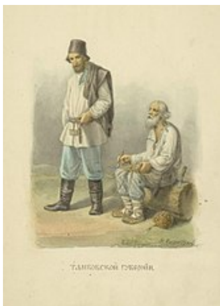
Фёдор Солнцев . Мужчины Тамбовской губернии -

98,6 % населения православные, 0,7 % магометане , 0,6 % сектанты (главным образом — молокане ). 98 % крестьян, 0,5 % дворян потомственных и личных, 0,5 % городских сословий. Во всем постоянном населении приходится на 1000 мужчин по 1041 женщин, собственно в городском наличном населении — на 1000 мужчин по 976 женщин.