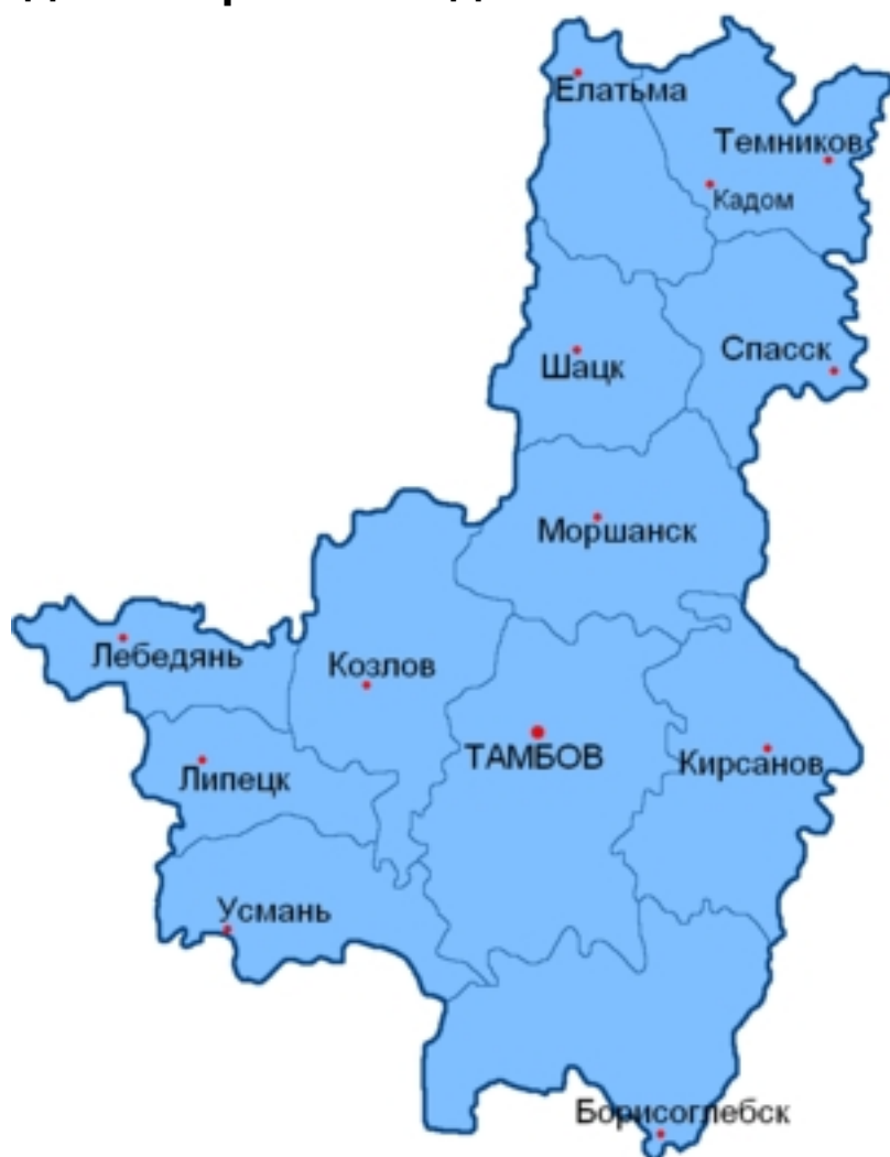
Карта административного деления Тамбовской губернии

В момент создания, в 1779 году , в состав Тамбовского наместничества входило 15 уездов: Борисоглебский , Гваздынский , Елатомский , Кадомский