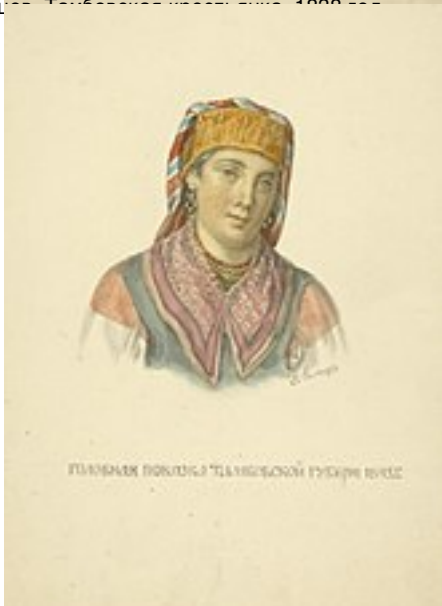
Фёдор Солнцев. Головная повязка Тамбовской губернии. 1845 год