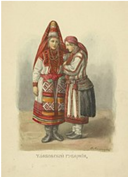
Фёдор Солнцев. Тамбовская губерния. 1854 г.